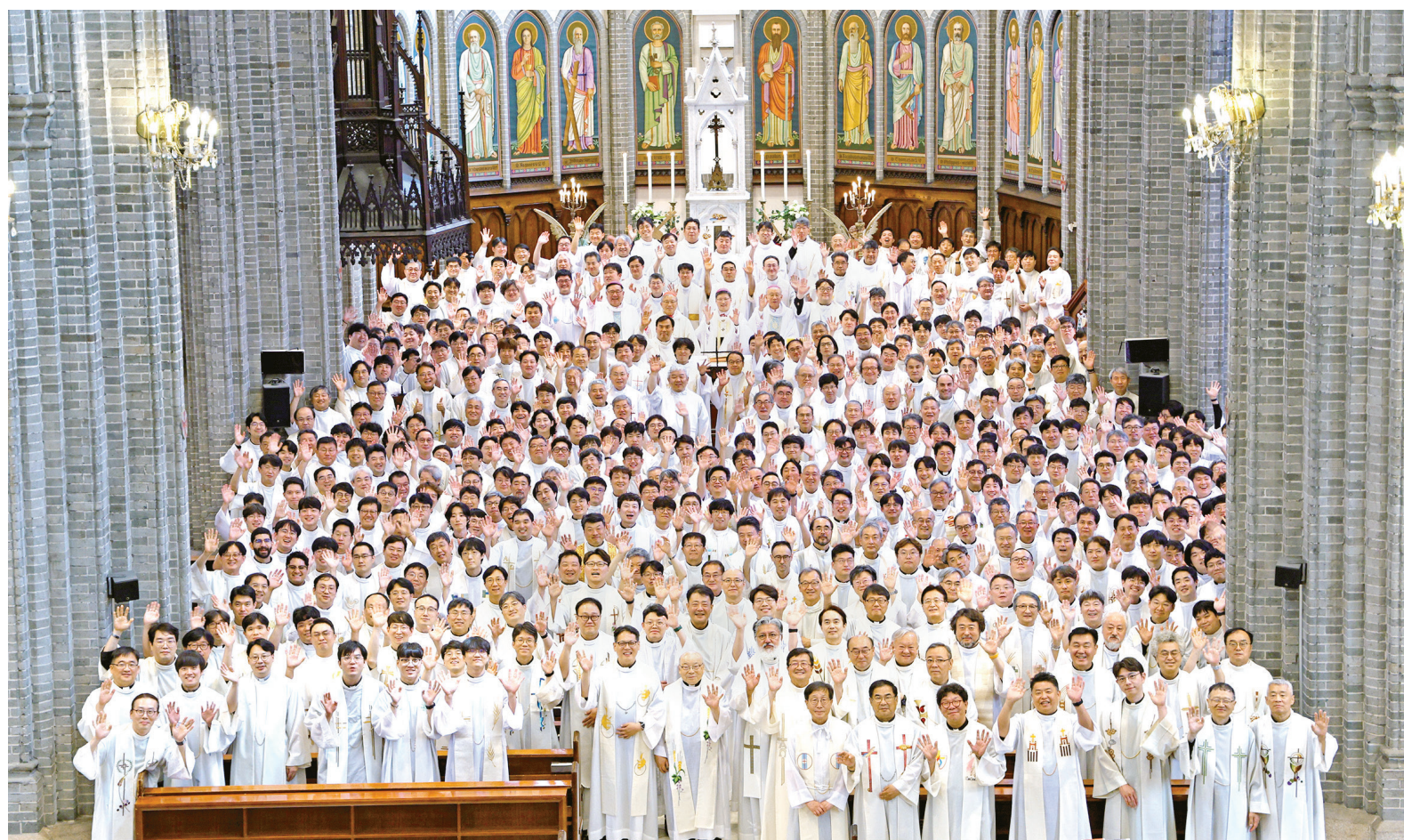
서울대교구 사제단이 6월 27일 교구 주교와 명동대성당에서 사제 성화의 날 미사를 봉헌한 후 성전 앞에 모여 손을 흔들고 있다.